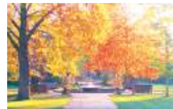
牛津大學植物園