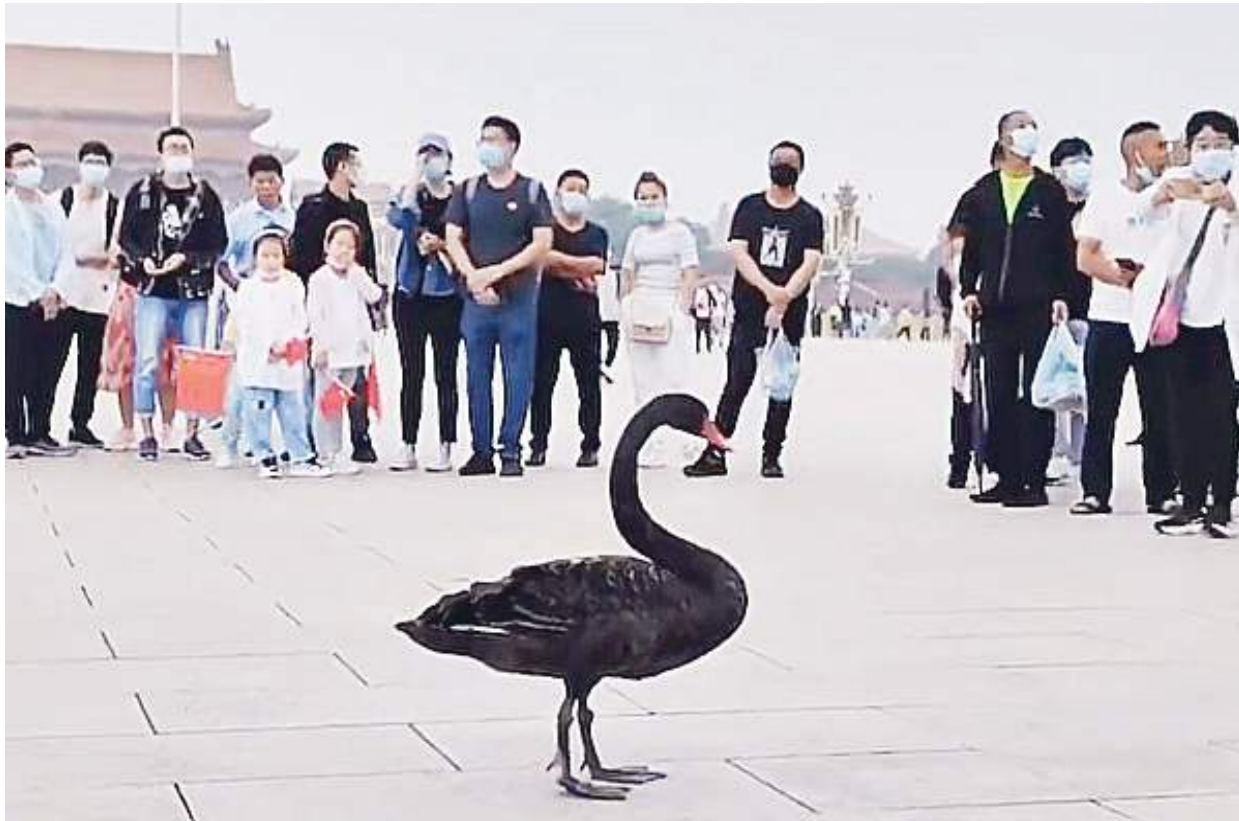
北京時間9月5日早上，一隻黑天鵝降落在天安門廣場，引發熱議。（視頻截圖）

事件被報導後，有微博網民問，「為何疏散遊客，天鵝沒過安檢嗎？」、「突破號稱『固若金湯』的低小慢飛行物防線了。」也有網民戲稱，這是「黑天鵝事