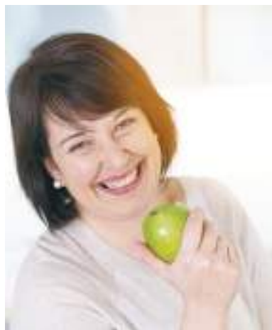
▲研究發現，新陳代謝減弱並不是中年發福的罪魁禍首。