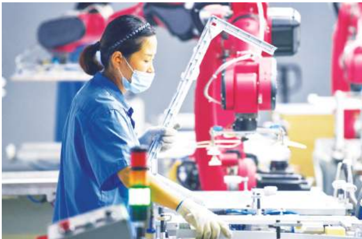
資本市場和企業有很多憂慮，經濟也出現下滑態勢。

根據官媒新華社報導，劉鶴表示，必須大力支持民營經濟發展，使其在穩增長、穩就業、調結構、促創新中發揮更大作用，「支持民營經濟發展的方針政策沒