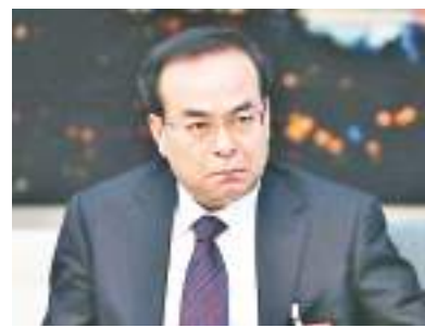
▲重慶市委原書記孫政才