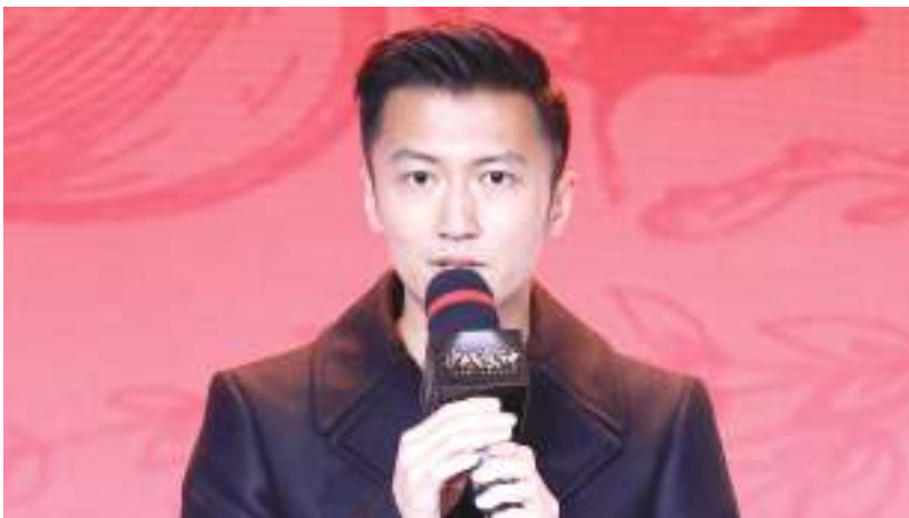
謝霆鋒表明正在申請退出加拿大國籍。有網臺節目指，謝霆鋒的做法不過是緩兵之計。

【看中國記者李懷橘綜合報導】大陸網絡早前瘋傳一份「限籍令」的封殺名單，謝霆鋒等持外國國籍的藝人均榜上有名。雖然封殺名單未得到官方證實，但謝霆鋒已率先表態，表明正在申請退出加拿大國籍。有網臺節目指，謝霆鋒的做法不過是緩兵之計，而他真正要做到反而是「保本保命」，在未被當局封殺前把資產轉移到海外。