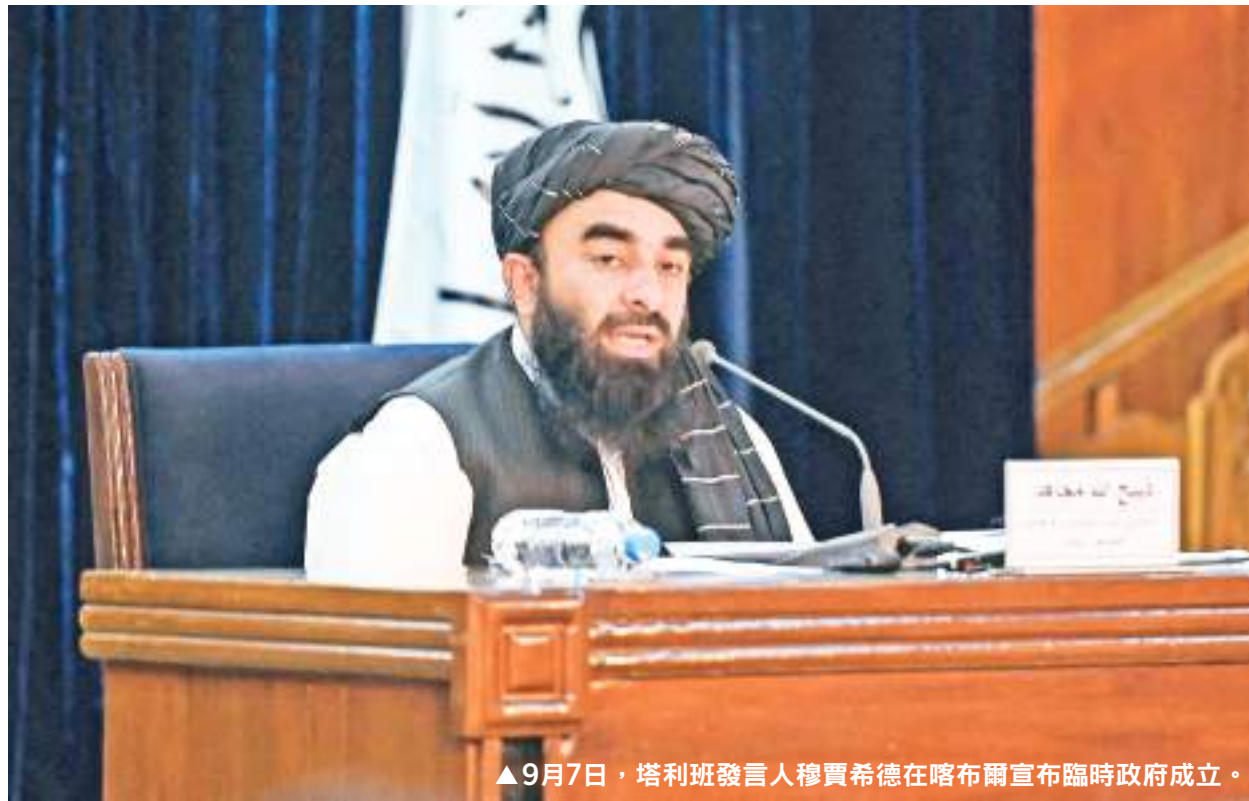
▲9月7日，塔利班發言人穆賈希德在喀布爾宣布臨時政府成立。

谷周圍被高山群繞，易守難攻。歷史上，潘傑希爾省曾成功抵抗了蘇聯從 1980 年代以來的攻占，塔利班從 1996 年到 2001 年的首次統治。過去這段時間內，潘傑希爾是唯一一個塔利班無法拿下的省分，許多前政府高官聚集該地區。