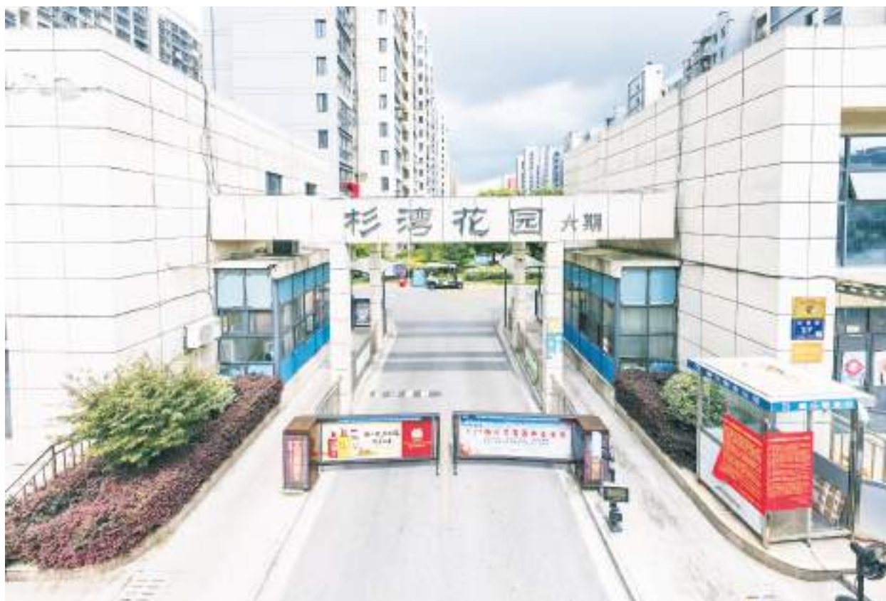
江蘇揚州一個因疫情被封鎖的居民區

外媒報導，在中國境內的密接者，或來自中高风险區的旅行者，都必須在隔離設施中隔離2~3週，按每天300元計算，最短的2週，也需要4000元上下，這對大多數中國公民來說，也不是