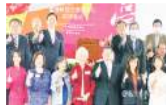
臺灣在美、英、法、德設立華語學習中心。(中央社)

在COVID-19疫情中，中國的全球商業聯繫也受到衝擊。中國主要港口對病毒的檢疫，嚴重干擾了國際貨運，某個作業區一旦被關閉，整個港口都必須停工。同時，三週的檢疫和旅行限制，也削弱了外國人前往中國的興趣。