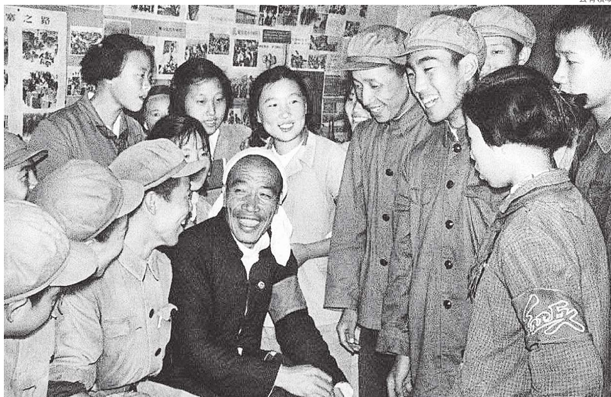
▲1966年的陳永貴與紅衛兵