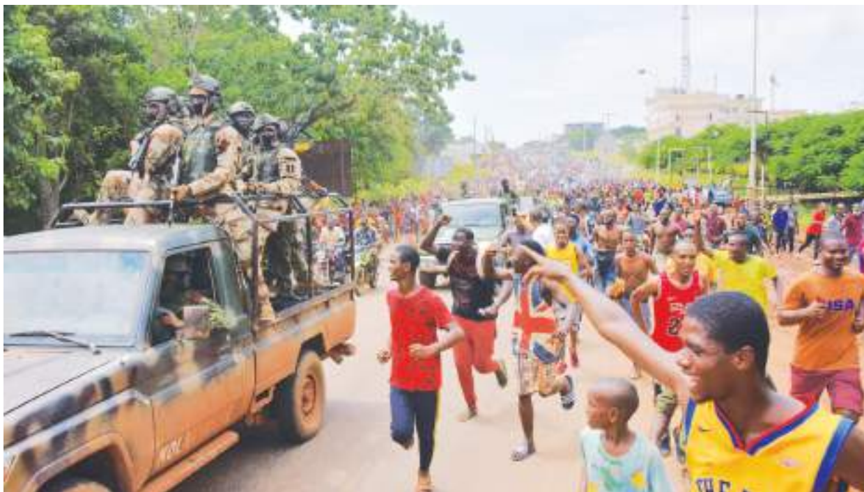
幾內亞5日發生一場非洲少見，如嘉年華會般受到人民夾道歡呼的軍事政變。

路透社6日披露，「科奈克里的主要行政區卡盧姆(Kaloum)周圍恢復了部分的交通，一些商店也重新開張，該區在整個5日都發生了激烈的槍戰。」該通訊社提到有報導稱，9月5日，幾內亞特種部隊成員「與忠於孔戴的士兵交