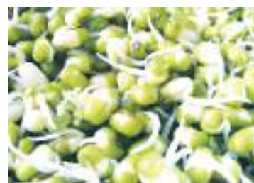
豆芽不能生吃。(公有領域)

輕微的食物中毒患者可能會出現胃部不適、噁心、嘔吐、腹瀉和發燒等常見症狀。這些症狀可能會在食用不潔食物後的數小時或數天後才發生。