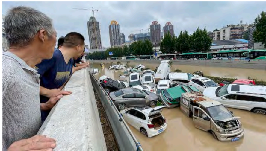
2021年7月20日，大水淹沒鄭州城區，圖為被淹沒的京廣隧道。

「7.20事件」一週年的任何報導。一位下班後去了5號線沙口路站的鄭州朋友說，附近都是便衣，「送不過來的。」後來，作者通過朋友好不容易送去了一束鮮花，也被專門檢查的收走了。文章最後寫道：「鮮花可以盛開，卻不允許被看到……」