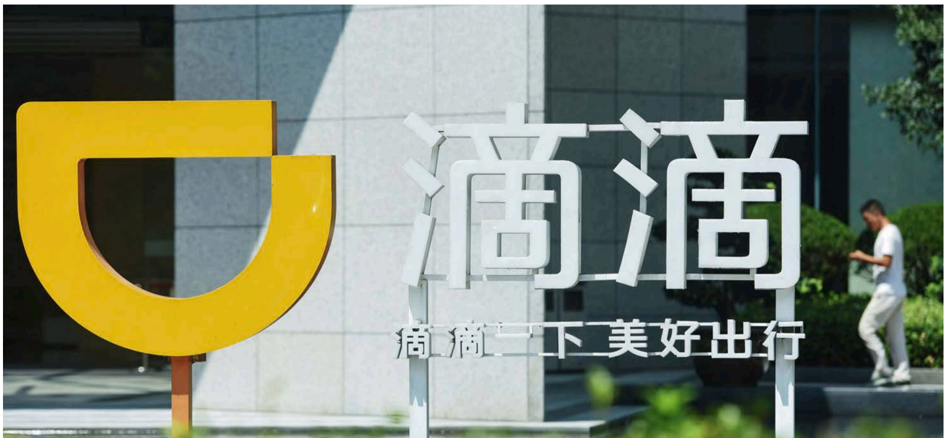
This photo taken on September 4, 2018 shows a logo of Didi Chuxing in Hangzhou in China's eastern Zhejiang province.