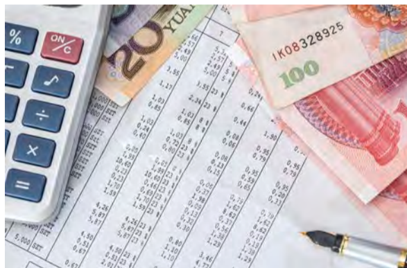
今年上半年中小銀行處置不良貸款5,945億元人民幣。

但是，就中國近期發生的爛尾樓保交樓問題與河南村鎮銀行弊案，銀保監會官員則閃爍其詞，實問虛答，不回覆具體問題。