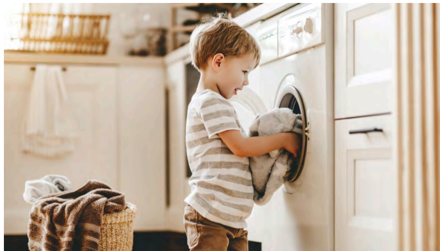
做家務活，培養孩子的責任感。