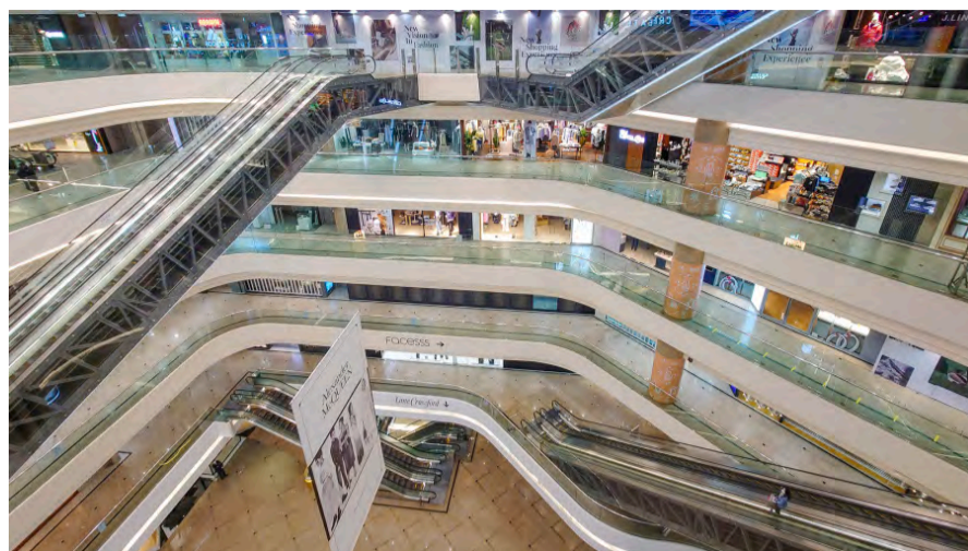
示意圖，冷清的商場。

不僅上海、廣州及深圳等地也出現商場關門、行人稀少的情況。微信公眾號「路探社」發布一條「華強北、廣州各行各業處於死亡邊緣，經濟出現負