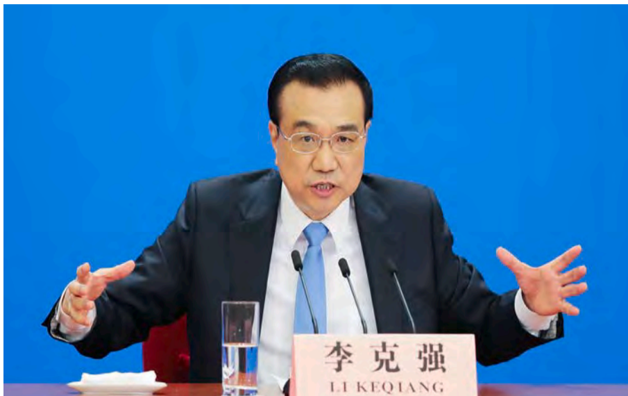
中國總理李克強召開國務院常務會議，表示要穩定房地產。

據世界銀行研究報告，發展中國家房地產投資對相關產業乘數效應為二倍以上。房地產開發是重要的中游行業，上游承載銀行等金融業、基礎化工、鋼鐵、建材、建築施工、工程機械、有色金屬等行業，下游銜接家電、裝修、物業、家紡等行業。