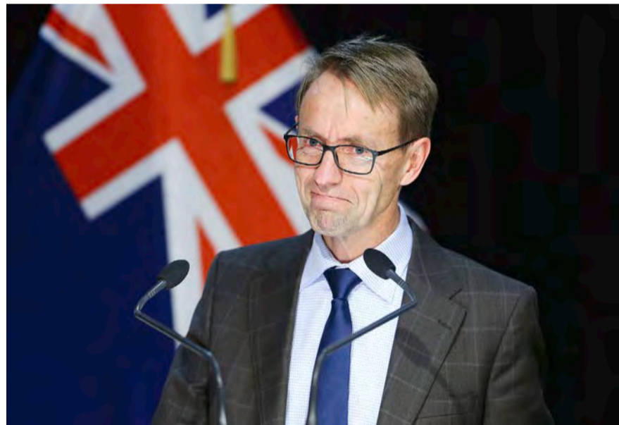
衛生部總幹事Dr. Ashley Bloomfield在一次防疫記者會上。

本週三當日，全國共有8,730例新報告的社區病例以及808例需要住院治療的患者。Bloomfield稱，新的國際研究數據證據表明，以前的COVID-19感染，特別是Omicron變體的感染，對BA.5變體提供了比預期更強的免疫力。目前BA.5仍然是紐西蘭社區中感染的最主要的變體，截至7月18日，有略高於60%的病例感染的是