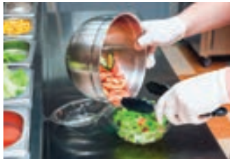
▲快速料理需先準備好食材。