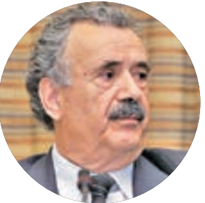
迪尼諾 (Consiglio Di Nino)

加拿大國會議員、聯邦保守黨副領袖蘭茨曼 (Melissa Lantsman) 當天給加拿大法輪大法佛學會發函表達支持。她在信中寫道：「四分之一個世紀以來，數以百萬計在中國的法輪功修煉者，僅因為選擇遵守『真、善、忍』的原則而被監禁、酷刑折磨和殺害。在中國境外，還有更多人因此成為騷擾和攻擊的目標。我期待著與你們並肩作戰。今天，值此週年紀念日，讓我們重申，致力於使加拿大成為地球上最自由的國家。」