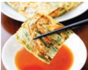
▲蔬菜煎餅也可以沾醬汁食用，為煎餅增添不同風味。

將所有食材切細，和麵糊一起油煎成餅狀，是另一種快速上菜的一鍋料理。適當的油煎火候可以讓煎餅外酥內嫩，分外美味開胃。選用適當的煎餅材料，可以創造更協調的口感，提升煎餅的風味，例如：多汁葉菜切絲做成煎餅，吃起來清甜美味，兼具高纖營養，若再加上肉類就是營養均衡的一餐了。