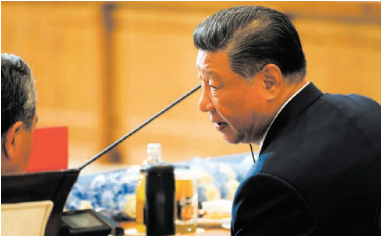
2024年7月4日，習近平在於哈薩克斯坦舉行的上合組織峰會上。

資深媒體人何良懋對《看中國》表示，三中全會的公報「改革」頻頻出現，但人們看完公報過後，卻感覺中共在「打著改革的旗號反