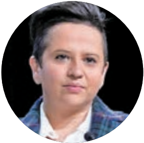
蘭茨曼 (Melissa Lantsman)