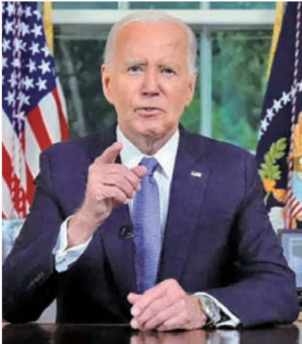
左圖：2024年7月24日，美國總統拜登在白宮橢圓形辦公室就退選決定向全國發表講話。；右圖：2024年6月17日，美國副總統賀錦麗（Kamala Harris）在艾森豪威爾行政辦公大樓發表講話。

拜登的這一決定來源於民主黨內部一個月來的巨大壓力。此前，他在辯論中的表現不佳，引發了人們對他年齡和能否成功擊