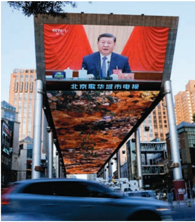
A giant screen shows news footage of Chinese President Xi Jinping attending the third plenary session of the 20th Central Committee of the Communist Party of China (CPC), in Beijing, China July 18, 2024.

posed at the Third Plenum hint at greater state intervention as the CCP attempts to move China towards greater self-sufficiency while strengthening its control over all aspects in the regime. Instead of the markets being permitted to play a "decisive role," the plenum called for both "market mechanisms" and the balancing of "deregulation with effective management." That is, while Beijing still wants a degree of economic liberalization to aid in resource allocation, it is prioritizing the strengthening of government control to prevent and deal with the "disorderly expansion of capital" that took root during the Jiang-Hu era.