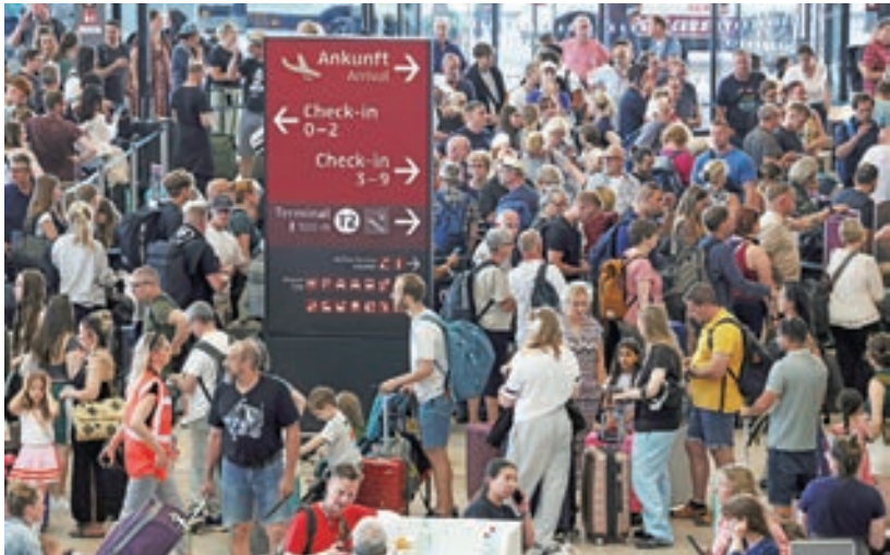
2024年7月19日，旅客在德國舍訥費爾德BER柏林機場的報到櫃檯等候，由於CrowdStrike軟體故障，導致多個行業數千次航班取消和營運混亂。

然而，CrowdStrike警告用戶需警惕趁機作亂的不法份子。公司發現有黑客正在傳播一個名為「crowdstrike-hotfix.zip」的惡意文件，偽裝成問題的「快速修復方案」。該文件實際包含可讓黑客遠程式控制或監視用戶