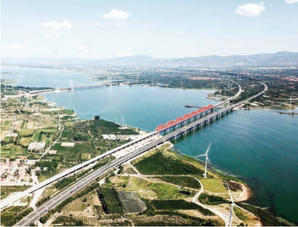
▲1969年北京曾受核威脅，林彪認為密雲水庫、官廳水庫和懷柔水庫會是蘇軍首先的轟炸目標。

【看中國記者李靜汝採訪報導】旅居德國著名學者王維洛博士近期在撰文中揭示，北京曾在1969年遇到來自前蘇聯的核武轟炸威脅。《看中國》記者就此採訪了王維洛博士。王維洛揭示說這場外交危機源於珍寶島「自衛反擊戰」，並指出當時林彪認為密雲水庫、官廳水庫和懷柔水庫會是蘇軍首先的轟炸目標。