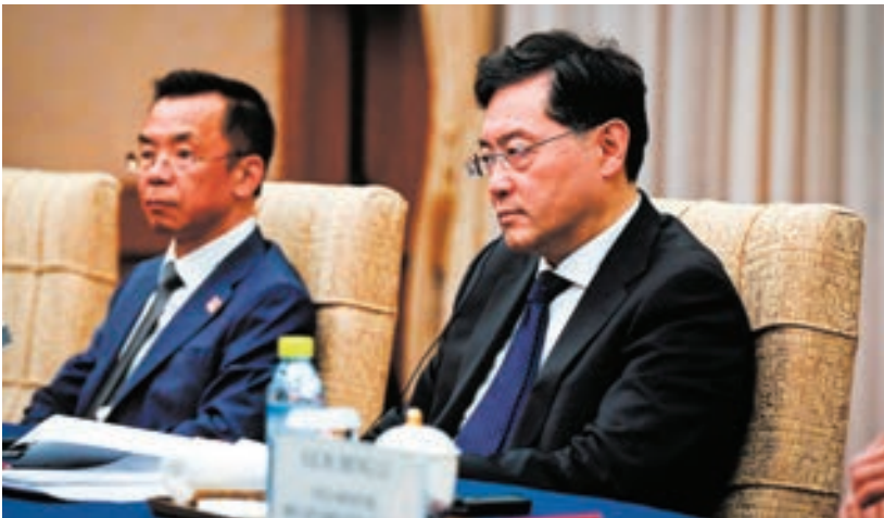
2023年4月5日，秦剛（右）在北京釣魚臺國賓館。

7月19日，在中共人大網公布的全國人大常委會公報中，提到秦剛，「因個人原因，由本人提出辭去人大代表職務」。