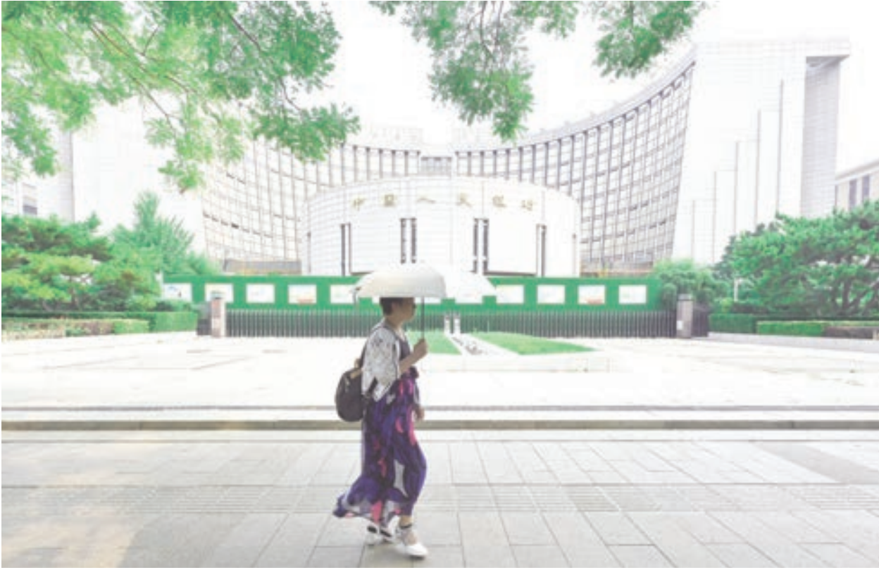
中共三中全會的中長期規劃對近期經濟增長影響甚微。

中國央行授權全國銀行間同業拆借中心公布，一年期貸款市場報價利率(LPR)從3.45%降至3.35%。該利率已於2023年8月下調。五年期抵押貸款基準利率從3.95%下調至3.85%。這是繼二月分小幅度下調後，今年的第二次下調。