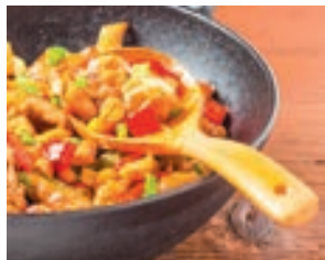
▲事先切好適口大小的雞丁，烹調時加上調料和配菜，快炒即可上桌。

事先備料，可以快速煮出美味的蛋白質料理，例如：事先把肉切薄片，或是處理成細絞肉。薄片可以快炒或煮滾湯，絞肉則可以用來做煎餅或蒸煮料理，只要食材新鮮，短時間烹調保留肉類的鮮美。同時，醃過的肉類不僅增加風味，也有軟化肉質的效果，很多快速出餐的方案，都會選用炸肉料理。