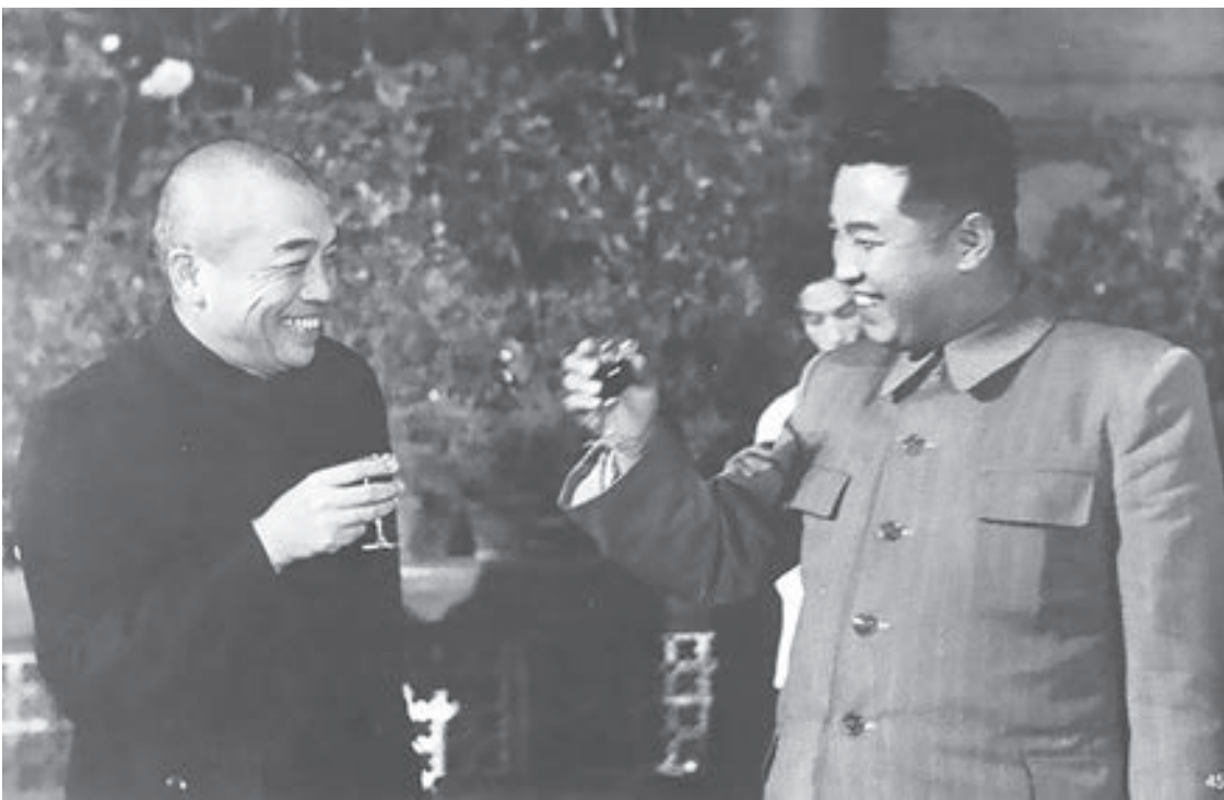
▲ 1955年，彭德懷（左）歡迎金日成（右）來訪。

「抗美援朝」戰爭結束後的 1953 年 11 月，金日成訪問中國，慷慨無比的中共大哥不僅將戰時費用一筆勾銷，還