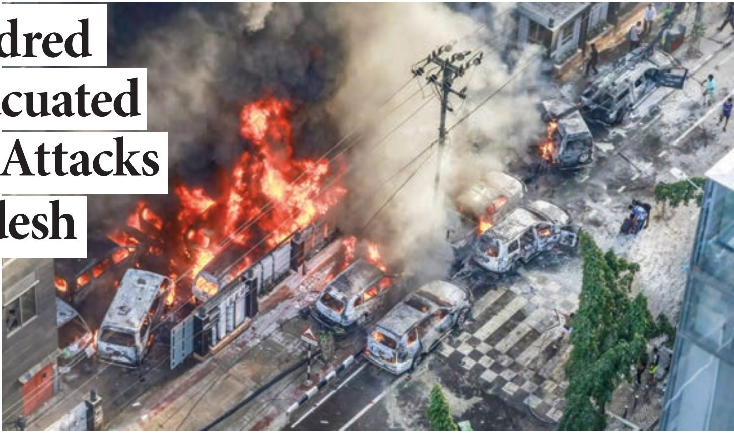
Smoke rises from the burning vehicles after protesters set them on fire near the Disaster Management Directorate office, during the ongoing anti-quota protest in Dhaka on July 18, 2024.

“The movement became known as the Students Against Discrimination movement. Many claim that they were not connected to any political group.”