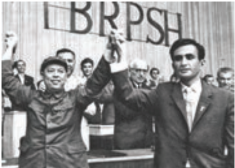
▲ 1966年，劉少奇（左）接見越南歌舞藝術團。