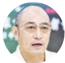
袁紅冰 著名時政評論家

【記者李靜汝採訪報導】據媒體綜合報導，中共上週剛結束的20屆三中全會發布的公報雖然高舉「全面深化改革」的大旗，但強調走「中國式現代化」的方向，令外界失望。旅居澳洲的著名法學家、時常披露中共高層動向內幕的袁紅冰教授，在接受《看中國》記者採訪時披露了中共高層圍繞中共三中全會的驚人內鬥內幕。