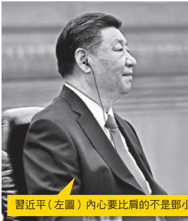
習近平（左圖）內心要比肩的不是鄧小平，而是毛澤東（右圖）。