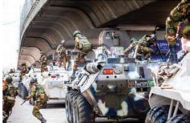
Bangladeshi soldiers disembark armored vehicles as they patrol the streets to disperse the anti-quota protesters in Dhaka on July 20, 2024. Soldiers were patrolling Bangladeshi cities on July 20 to quell growing civil unrest sparked by student demonstrations, with riot police firing on protesters who defied a government curfew.