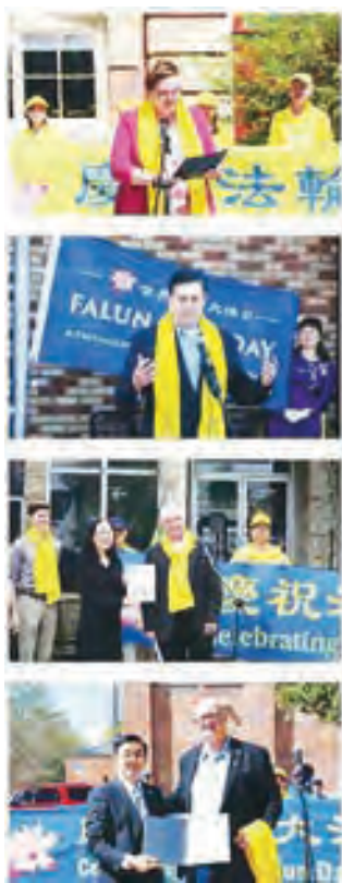
左側小圖和中間大圖：加拿大安大略省多個城市相繼舉行升旗儀式，慶祝法輪大法洪傳32週年。右側小圖：多位國會議員和人權律師麥塔斯（右上）在渥太華集會中發言，褒揚真善忍價值。（看中國合成圖）

Genuis）感謝法輪功學員25年來堅持和平反迫害。「我要感謝你們的堅韌不拔，年復一年地來到這裡提出訴求。感謝你們帶來了真善忍的價值觀，讓加拿大變得更加強大。」貝讚說。