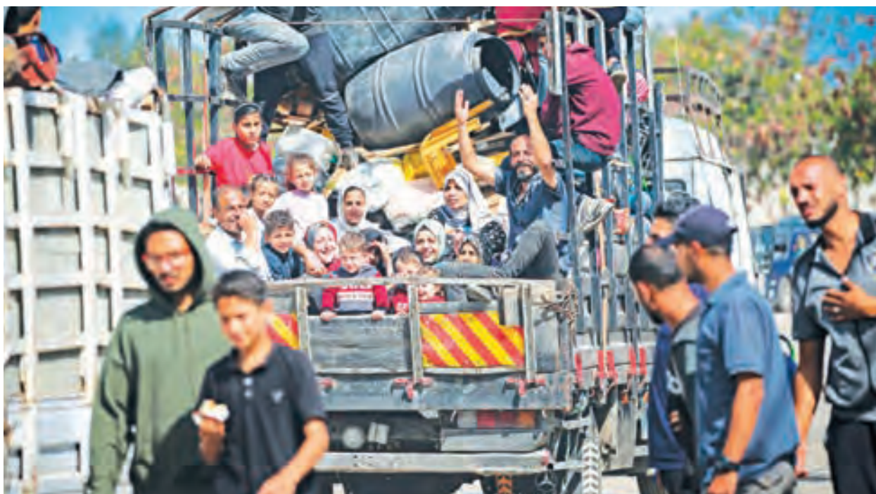
以軍7日占領拉法邊界關卡，戰火一觸即發，當地居民紛紛逃離。

據BBC報導，一位未具名的以色列官員告訴路透社，哈馬斯接受的提案是埃及提案的「軟化」版本，其中包括以色列無法接受的重點結論。這位官員說：「這似