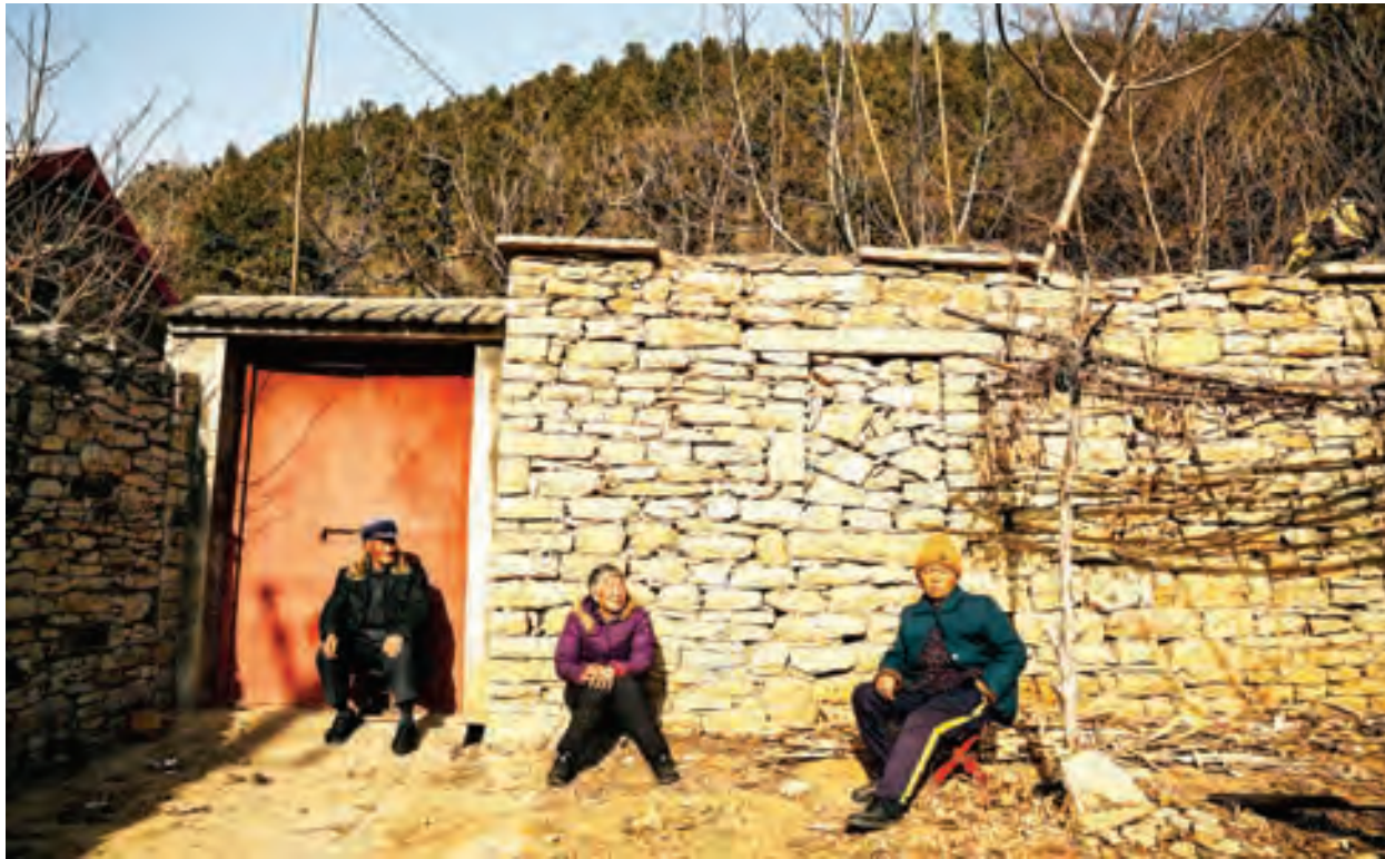
中國農村老人

有 4400 萬名 60 歲以上的老年人屬於半失能、失能和失智狀態，相當於每六位就有一位生活無法自理。而王巍口中沒有足夠退休金和醫保的家庭，並非少數族群。