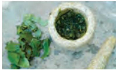
Wash, chop, and mash up comfrey leaves for a quick and effective poultice.

Comfrey tea can help with a wide variety of internal issues, including ulcers, digestive concerns, respiratory ailments, bladder and bowel irritations. Keep in mind: consuming large, concentrated amounts may adversely affect the liver.