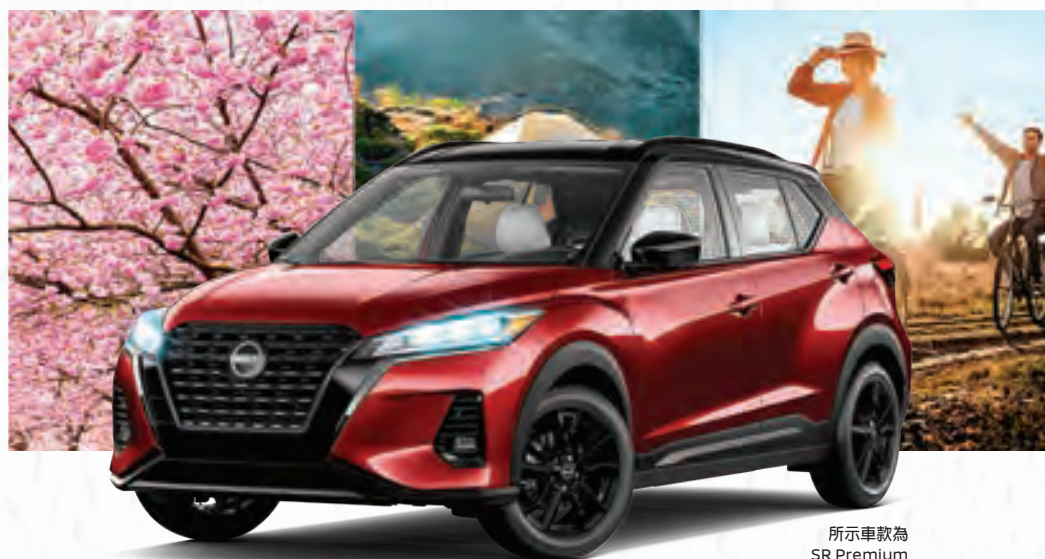
所示車款為 SR Premium