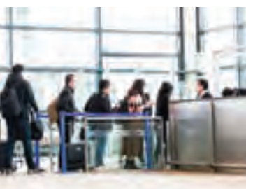
上海機場

據官媒澎湃新聞查詢發現，發生塌方的廣東梅龍高速去年也因暴雨發生過塌方。據當時的交通管制公告顯示，經現場踏勘發現該處地質複雜，有數萬方土方傾覆車道的重大安全隱患。梅大高速建成僅 10 年就發生多次崩塌，引發民眾對豆腐渣工程的批評。