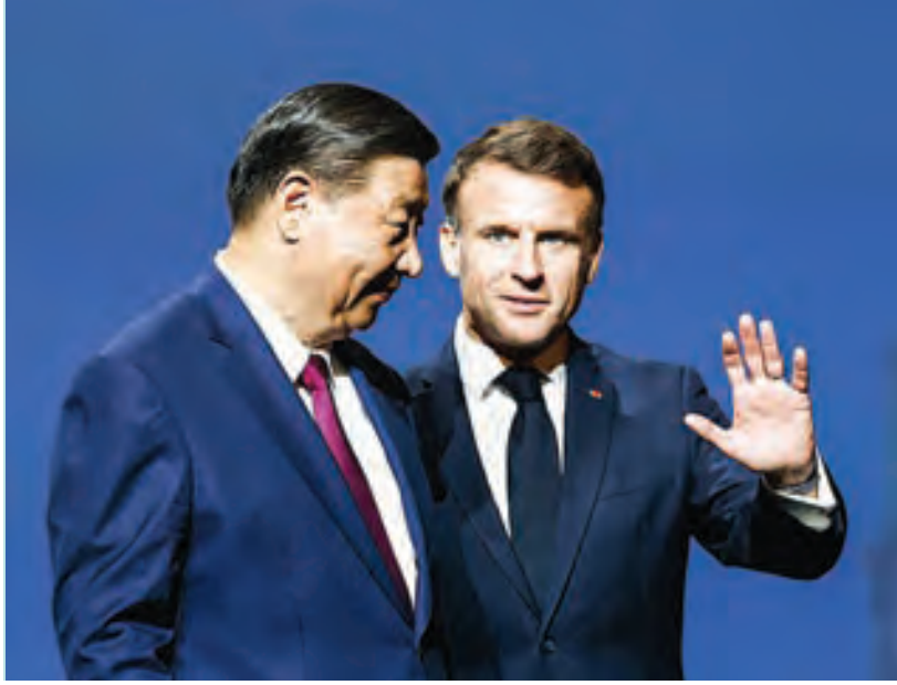
France's President Emmanuel Macron (R) and China's President Xi Jinping (L) wave as they conclude their attendance at the sixth meeting of the Franco-Chinese Business Council at The Marigny Theatre in Paris on May 6, 2024, during an official two-day state visit hosted by the French president.

According to the EU Commission's president Von der Leyen, the bilateral relationship has suffered from unequal market access and Chinese state subsidies that unfairly boost its otherwise vastly bloated industrial capacity. The European