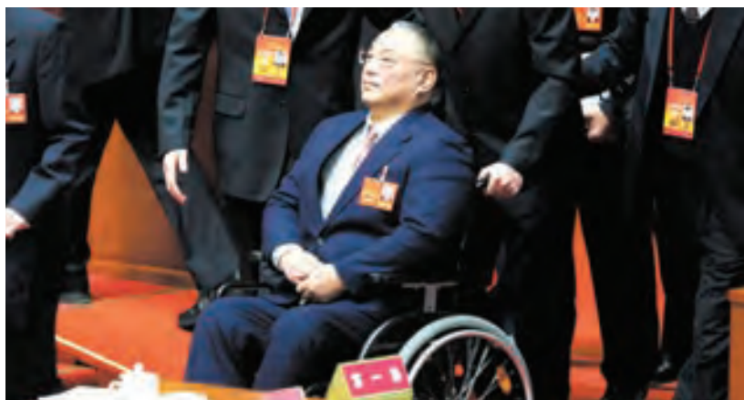
鄧小平的長子鄧樸方

中信集團可以說是鄧小平家族的「金庫」。它的前身是中國國際信託投資公司，是鄧小平批准，