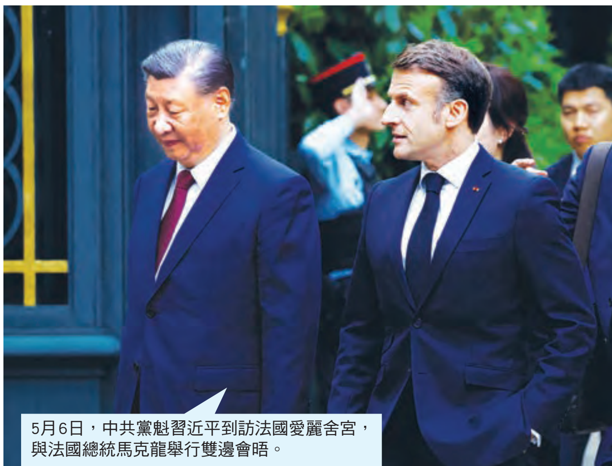
5月6日，中共黨魁習近平到訪法國愛麗舍宮，與法國總統馬克龍舉行雙邊會晤。

法國電視1臺及電視2臺分別在習近平訪法當天及訪法前，曝光了中共海外警察企圖遣返異議人士的事件。法國電視2臺(France 2)的專題報導中，直擊中共駐法大使館、中法協會成員、中共地下警察、中共公安局、僑民組織密切