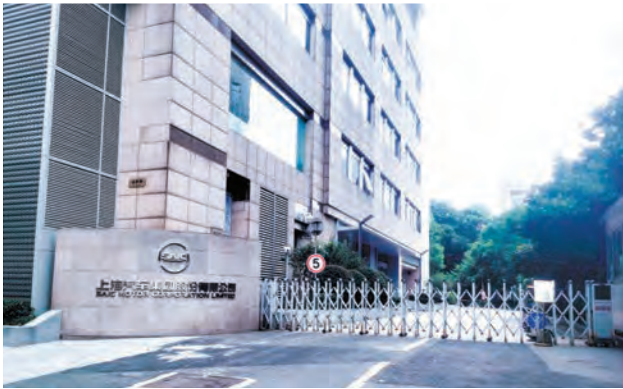
上汽集團是中國四大汽車製造商之一。圖為上汽集團的總部大門。

近期坊間頻傳江澤民的長子江綿恆和孫子江志成已經「出事」了。自媒體人姜光宇在近期節目中談到了習近平是如何誘捕江澤民的兒子和孫子的。據稱，習近平之所以動手，是因為此舉不但可以除掉最大的潛在威脅，還可以收繳巨大財富、緩減財政壓力。習上位後，在反腐中發現，江家幫、江曾集團在軍中勢力巨大，根本不是扳倒郭伯雄、徐才厚、張陽等人後就可以高枕無憂，江綿恆也參與火箭軍、軍工集團兵器集團的陰謀中，於是習近平決定連根拔除江家勢力。 習近平在十九大連任之前，與江曾集團做過政治交易，答應不動江曾家族後人，但江綿恆必須待在國內，幫助發展科技生產力，支持中央。江家猜到這是藉口，其實是被當了人質。從此，