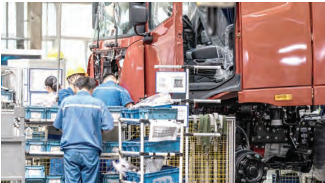
發改委召開專題座談會與民企溝通大規模設備更新。

為刺激消費，中共國務院今年3月1日審議通過《推動大規模設備更新和消費品以舊換新行動