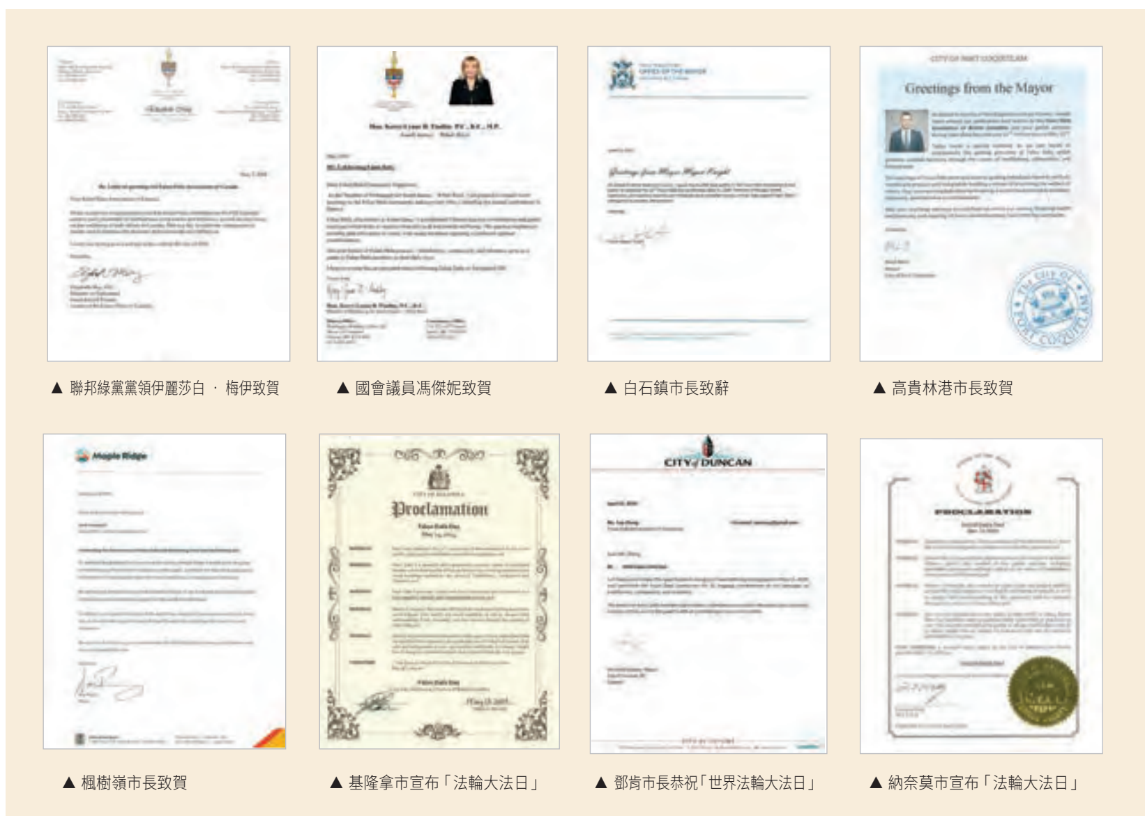
▲ 聯邦綠黨黨領伊麗莎白·梅伊致賀

在你們於2024年5月13日慶祝法輪大法洪傳32周年之際，我謹代表白石鎮市議會向法輪大法社區致以最美好的祝願。擁有思想、