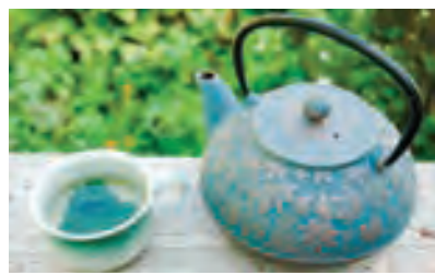
Comfrey tea is mild, soothing and easy to make.

A hot tea can be made by pouring boiling water over a small amount (one teaspoon) of dried comfrey leaves or roots, or a larger amount of fresh material. Allow it to steep for ten minutes. A cold brew takes several hours, but is better for bringing out the soothing mucilaginous properties of the herb.