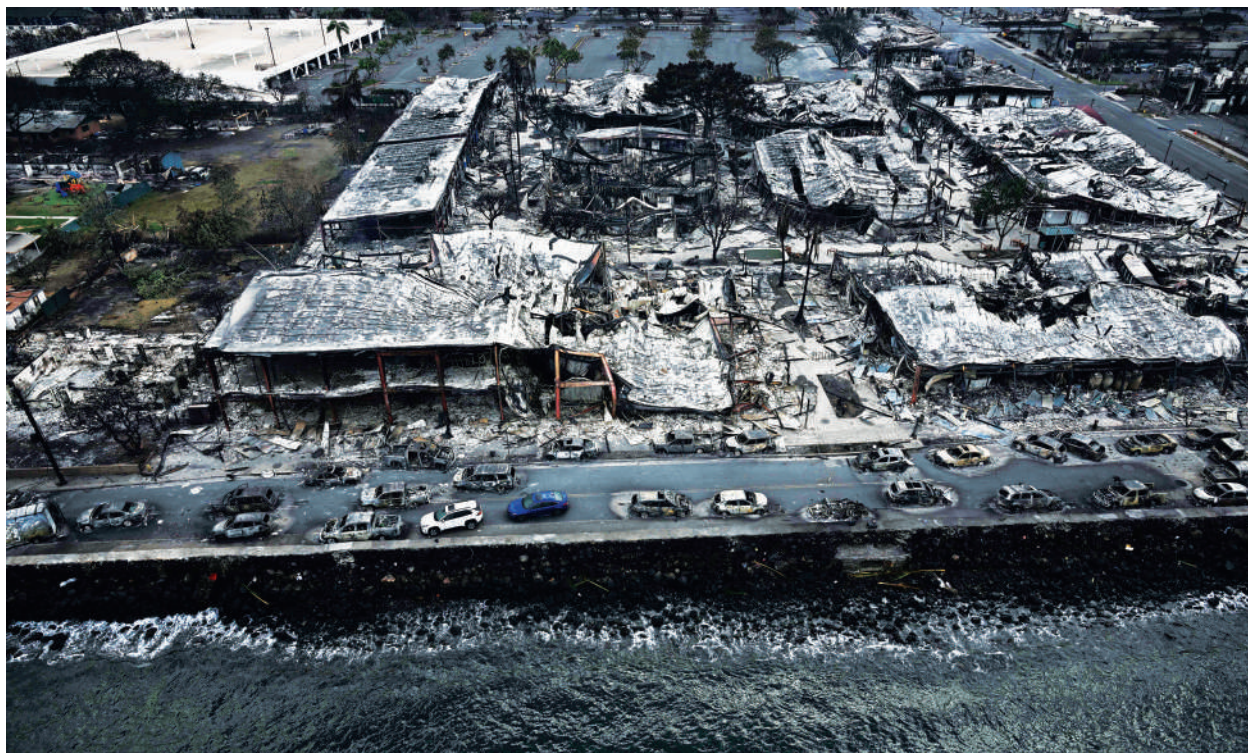
2023年8月10日，夏威夷毛伊島西部山火過後，拉海納海濱被燒燬的建築物及車輛。

正在準備滿足社區的長期需求，這個社區幾乎沒有時間去理解和哀悼失去親人、家園、企業和幾個世紀的古老文化遺產所帶來的損失。