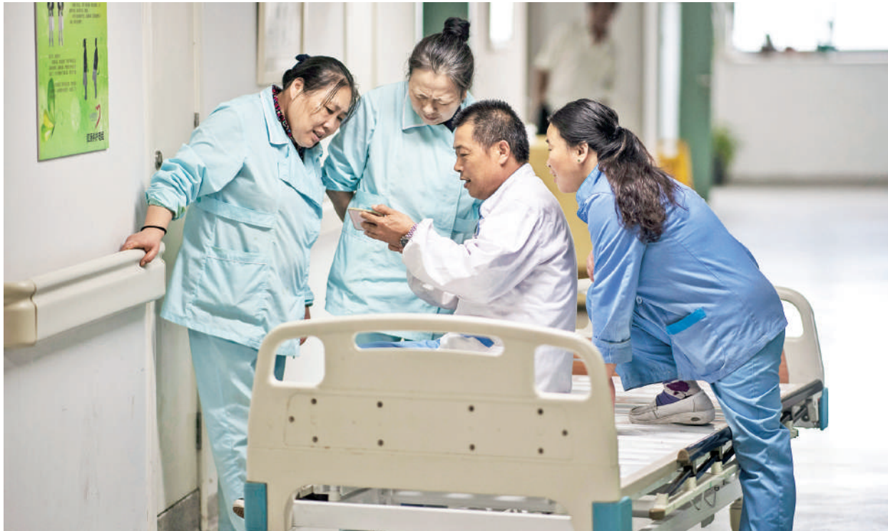
中國醫療界近日風聲鶴唳。

【看中國記者鄭辛言綜合報導】近日，中國掀起醫藥領域反腐行動。截至8月14日，全國至少177位醫院院長、書記被查。中國醫藥行業隱蔽、複雜的貪腐手段，被公諸於眾。對此，有評論認為，中國醫療界存在的腐敗現象，絕非個別領域的問題，而是制度問題。