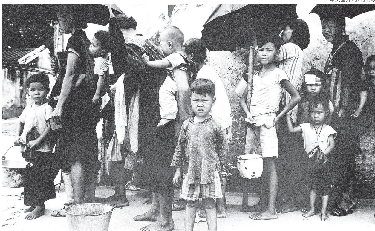
▲1962年5月，因為大躍進造成的大饑荒，造成中國難民湧入香港，排隊等候吃飯。

可是不幾天，「全部5分」的口號也顯得保守落後了，因為據說別的中學已提出在初中學完高中課程，有的學生還準備著書立說。