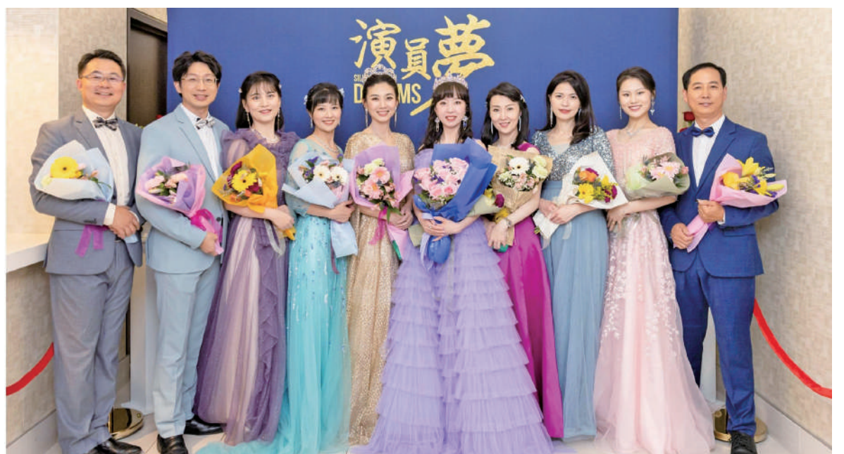
《演員夢》多倫多首映式上新世紀影視部分演員合影。

警方在通報中呼籲，如果民眾有事發時附近區域的監控錄像或行車記錄視頻，請致電1-866-876-5423轉6630或1-800-222-TIPS聯繫警方。