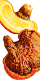
當時各地上奏靈芝等祥瑞，但宋真宗下詔禁止進獻珍禽和祥瑞。

綜上所述，宋真宗封禪，既不是出於愚昧，也不是出於炫富，更不是因為喜歡沉浸在歌功頌德的氣氛中，那麼是不是說「一國君臣病如狂」？其實是另有原因，正如標題所云：「四海息兵天書降，封禪未必病如狂」。至於宋真宗封禪到底是出於何種原因，以及這件事將如何結束？且待下回分曉。（待續）