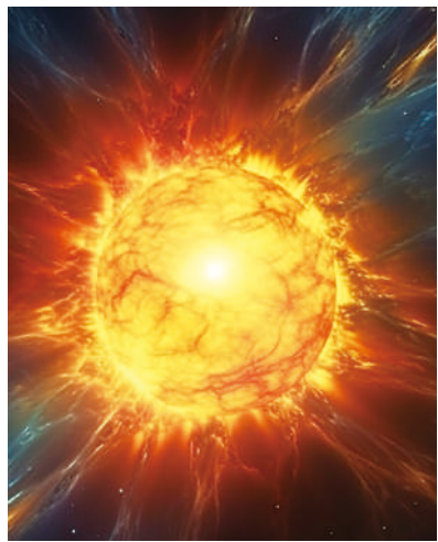
▲美國上空出現一道火流星，巨大的光芒穿透了六個州的夜空。(示意圖)