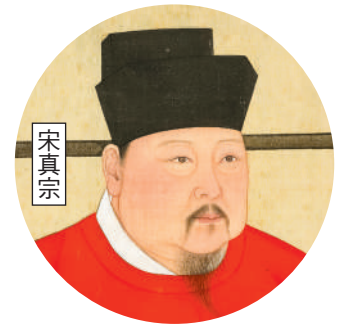
宋真宗、寇準、(不喜珠飾)：公有領域；李德明、李元昊：網絡圖片；其他未註明圖片：ADOBE STOCK