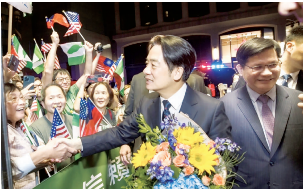
賴清德於8月13日在紐約會見700多位僑胞，他一再強調，「臺海和平，世界就和平」。

賴清德是明年1月臺灣總統大選的民進黨主要候選人，也是目前在臺灣民調最高的總統候選人。美國表示，不會在臺灣選舉中選邊站，同時也反對境外勢力