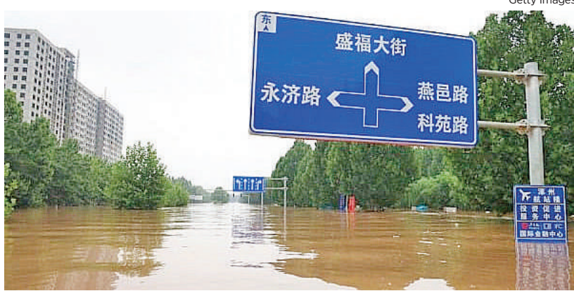
2023年8月2日，河北省涿州暴雨後被洪水淹沒的街道。

之前，央視造假新聞裡的那部飛機。這部配合央視做假的直升機，隨後拉著重要的軍方要員、政府交通局副局長、保定電視臺記者，撞上了高壓電線，機毀人亡。