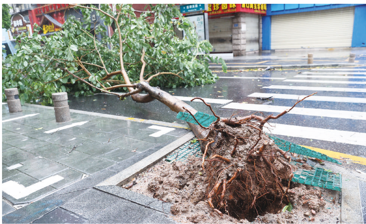
▲2023年7月28日，颱風杜蘇芮登陸中國福建省廈門市，將行道樹連根拔起。