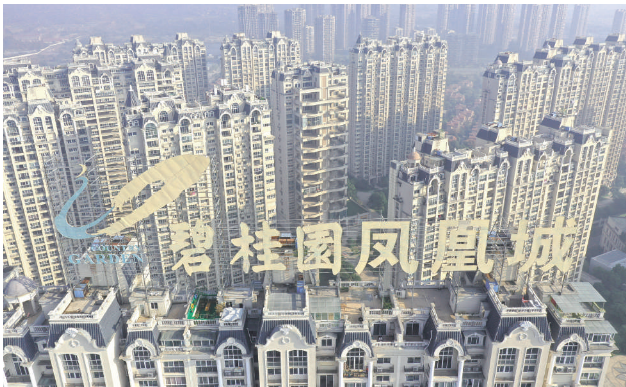
債務危機不斷發酵，中國樓市壞消息接踵而至。

碧桂園表示，其利潤率已經縮窄，房地產項目價值縮水，樓盤銷售已經連續4個月下降，再融資也變得困難得多。日前，碧桂園未能按時支付2250萬美元的美元債券利息，碧桂園有30天的