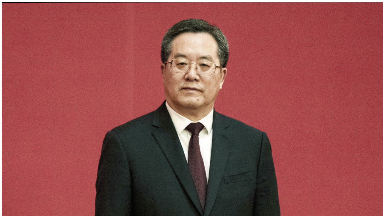
中共中央政治局常委、國務院副總理丁薛祥

時事評論員鍾原16日撰文表示，中共領導人應相繼離開北戴河，習近平此時的指示，被黨媒視為「重大政治問題」，暗示