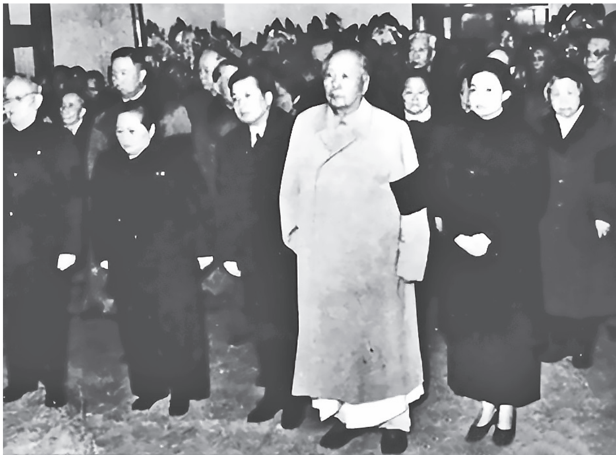
▲毛澤東穿白色睡衣參加陳毅追悼會。

10月8日，毛會見埃塞俄比亞(Ethiopia)的君主海爾·塞拉西(Haile Selassie)時，只說了寥寥數語，周恩來早早地結束了會見。林彪出逃前一天才見到毛的官員，吃驚地發現毛一個月不到，形容全非。