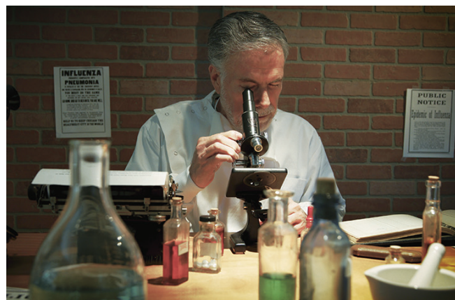
實驗人員在芳草島（Island of Yerba Buena）從海軍訓練中心的士兵中選出了50名自願參與實驗的健康人。在確定受試者實驗前絕對沒有接觸或者感染流感後，他們

每個受試者都要這樣接觸10位病人，這些病人嚴重發病都不到3天，正是傳染力極強的時候。但測試結果卻讓所有人目瞪口呆，因為沒有一個人被感染。在舊金山灣的天使島（Angel Island）隔離中心，一個類似的實驗也在進行著。