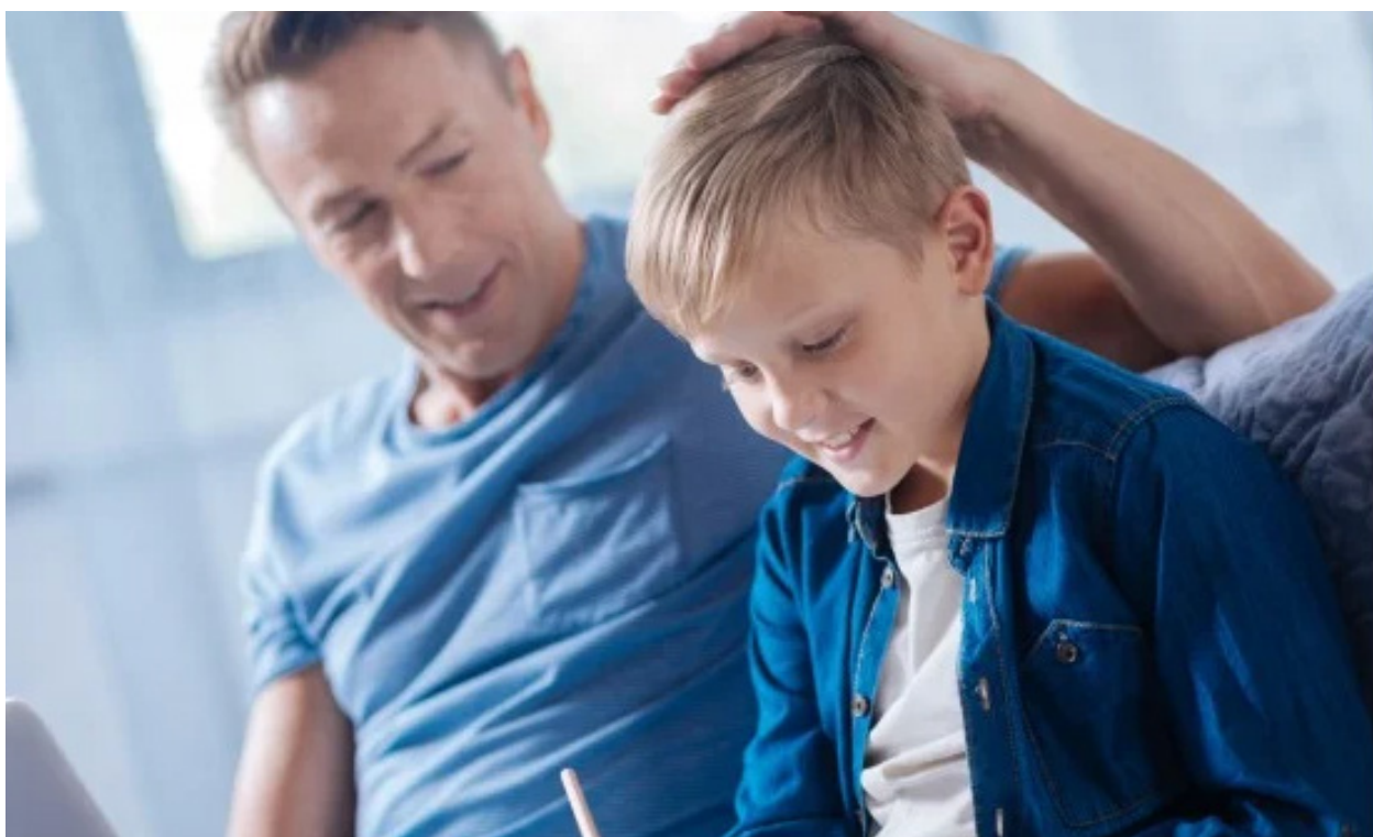
當孩子表現出創造力或提出新穎的想法時，家長應該給予充分的肯定和誇獎。

例如，孩子在遇到學習難題時沒有氣餒或放棄，而是嘗試用多種方法解決問題，我們可以說：「你處理問題的方式很成熟，我很欣賞你的冷靜和理智。這種面對挑戰的勇氣和能力是非常寶貴的，我相信你會在未來的學習和生活中更加出