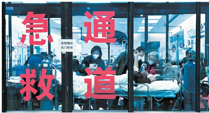
去年 1 月，上海一家醫院的急症室。

中國社會科學院馬克思主義研究院 3 月 4 日發布訃告，中共黨員、馬克思主義理論家、中國人民大學原馬列所所長、中共中