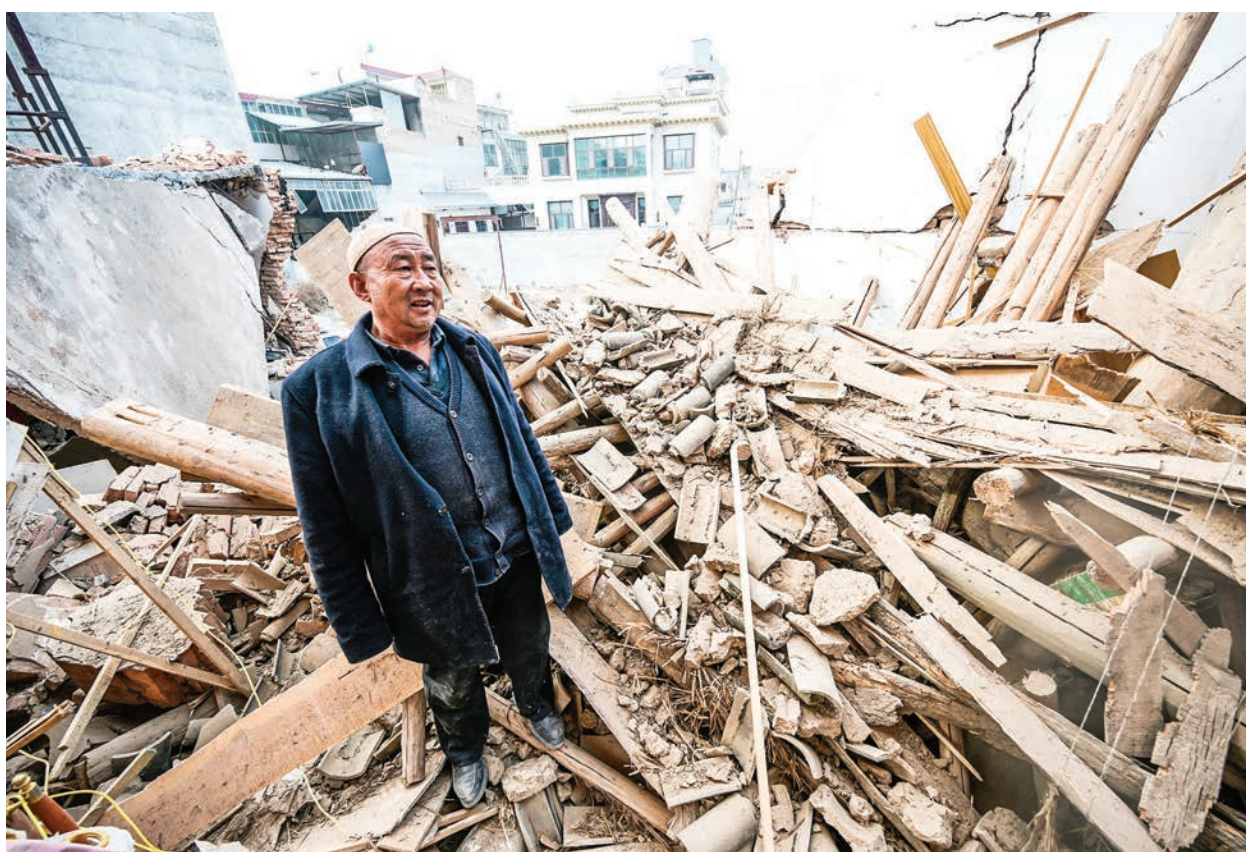
▲2023年12月20日，中國西北部甘肅省積石山縣大河家發生地震後，一名男子正在檢查一棟受損的建築。

對於現代的中國人來說，甘肅積石山縣是一個偏遠落後的地方。但是中國最早的地理書《尚