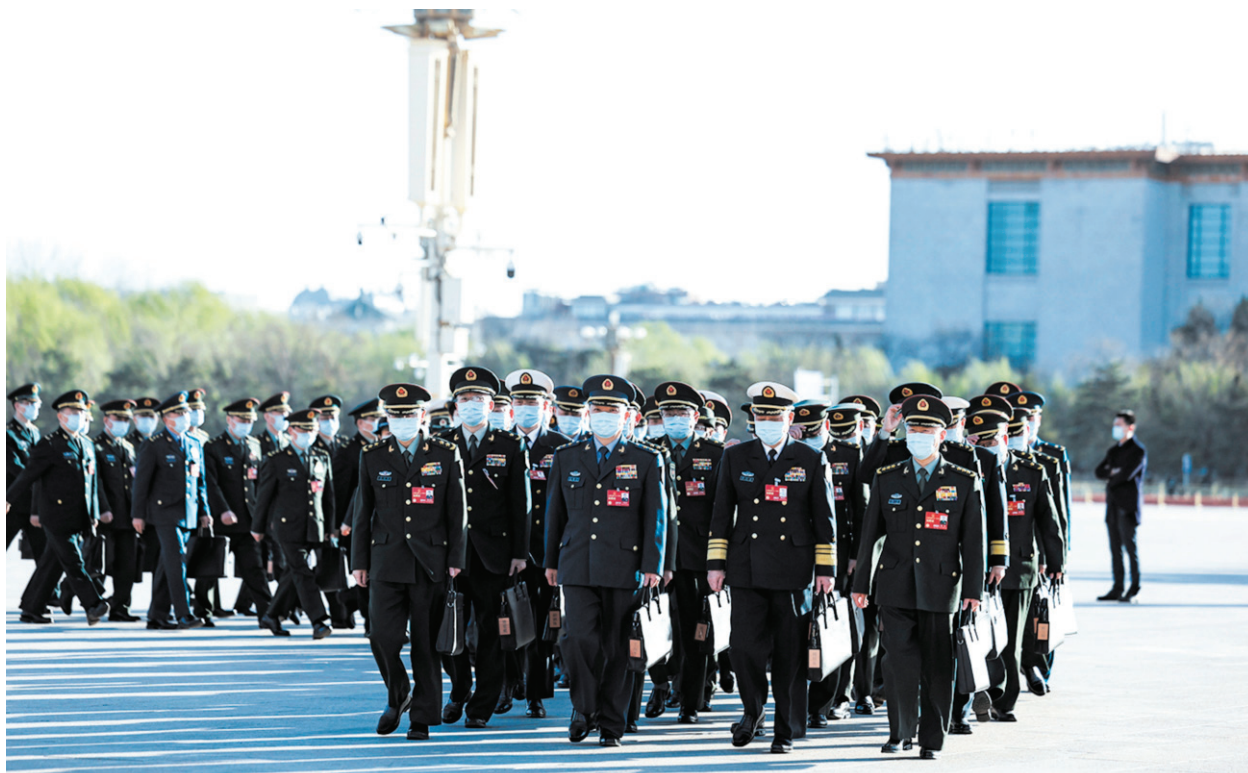
去年 3 月 12 日，出席中共兩會的軍方代表們列隊進入會場。

2023 年春節前後完成了對劉亞洲的調查，劉亞洲已被雙開，同時也被移交軍隊司法系統處理。同時中共軍方在 3 月分開始清除「劉亞洲有害信息」，涉及劉亞洲的圖書、報紙、期刊、文章、題字、講稿等全部下架和銷毀，並對劉進行批判。