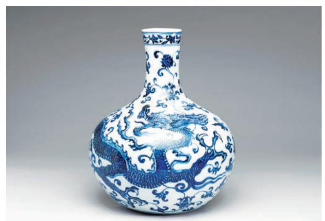
「青花瓷」是東方文化代表，流傳廣泛。圖為青花穿蓮龍紋天球瓶

腹有如圓球，腹上延伸直頸、小口，下有假圈足立地。碩大的圓球腹非常醒目，像是天上降下來的圓球，所以稱之爲「天球瓶」，是永樂時期青花瓷器的代表作之一。