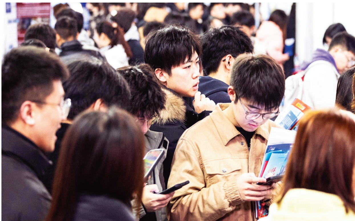
大陸年輕人

中共黨魁在去年底發表2024新年賀詞時，宣稱「祖國統一是歷史必然」，去年當局亦下令共軍做好戰鬥準備。對此，邵先生說，大陸和臺灣的任何戰爭都會對雙方造成重大傷亡，「統一臺灣」不值得發動戰爭，中國大陸很多年輕人拒絕為攻臺而死。