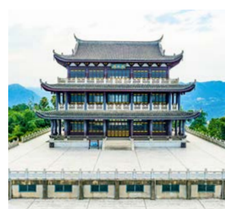
▲報國無門，陳子昂登上幽州臺，寫下〈登幽州臺歌〉。

〈登幽州臺歌〉取意於《楚辭·遠遊》：「惟天地之無窮兮，哀人生之長勤。往者余弗及兮，來者吾不聞」之句意，卻更為遼遠，餘韻無窮。全詩只有二十二個字，篇幅甚短，卻涵涉了巨大的時空。詩人跨越遙遠的過往與未來，又容入了無垠的天地宇宙，而將個人的胸襟置於其中。前兩句語氣急促，表現了作者抑鬱不平之氣；後兩句襯以虛字「之」、「而」，轉為舒緩流暢，表現詩