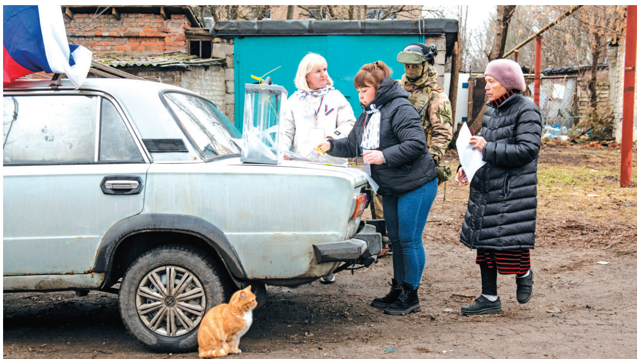
荷槍實彈的軍人攜票至占領區民宅門口「監督」投票。

華府智庫歐洲政策分析中心的主任格林指出，俄羅斯於烏東占領區的總統大選狀況，可說是軍事與戰爭本質的延伸，而並不是在行使民主選舉權。烏克蘭智庫彭塔中心（Penta Center）的負責人費森科指稱，克里姆林宮把烏