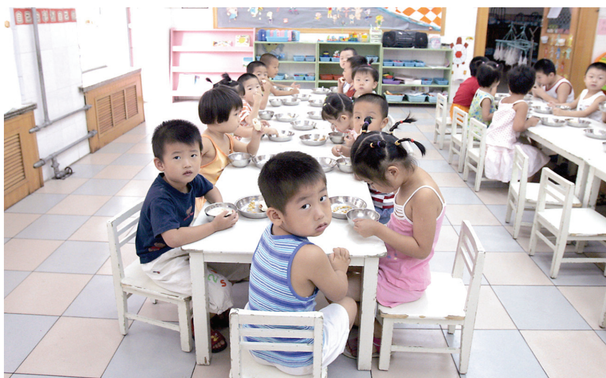
幼兒園到大學等相關教育及產業的危險信號出現，對中國經濟也產生深遠影響。

據《每日經濟新聞》等媒體報導，新生兒數量銳減，意味著許多醫院的產科無法繼續運營，產