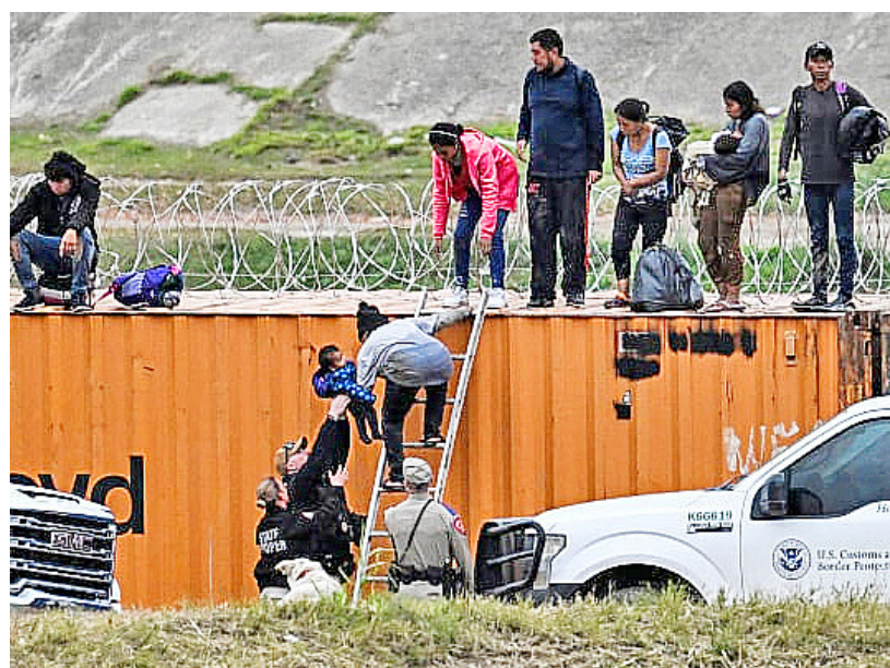
2023年12月22日，在德州伊格爾帕斯，美國海關和邊境保護局工作人員從一位越境美國的女子身邊接了一名兒童。(CHANDAN KHANNA/AFP via Getty Images)

「(儘管)最高法院暫停執行SB4法案，但德州仍會使用權力逮捕那些非法入境和有其他違法行為的非法移民。」阿博特